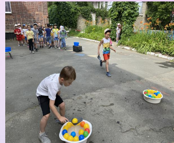
Эстафеты с водой